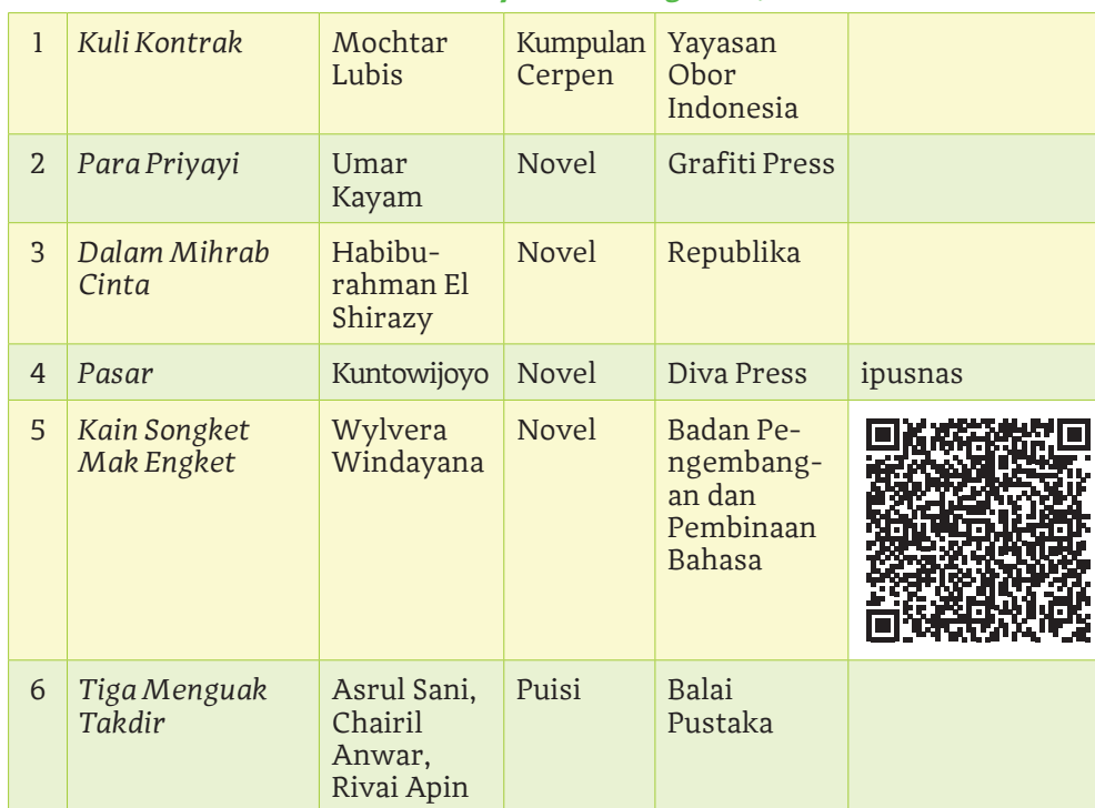
Tabel 2.1 Rekomendasi Karya untuk Kegiatan Jurnal Membaca

Pilihlah dua atau tiga karya dari beberapa karya berikut yang dapat kalian jadikan alternatif pilihan bacaan pada kegiatan jurnal membaca pada Bab 2.