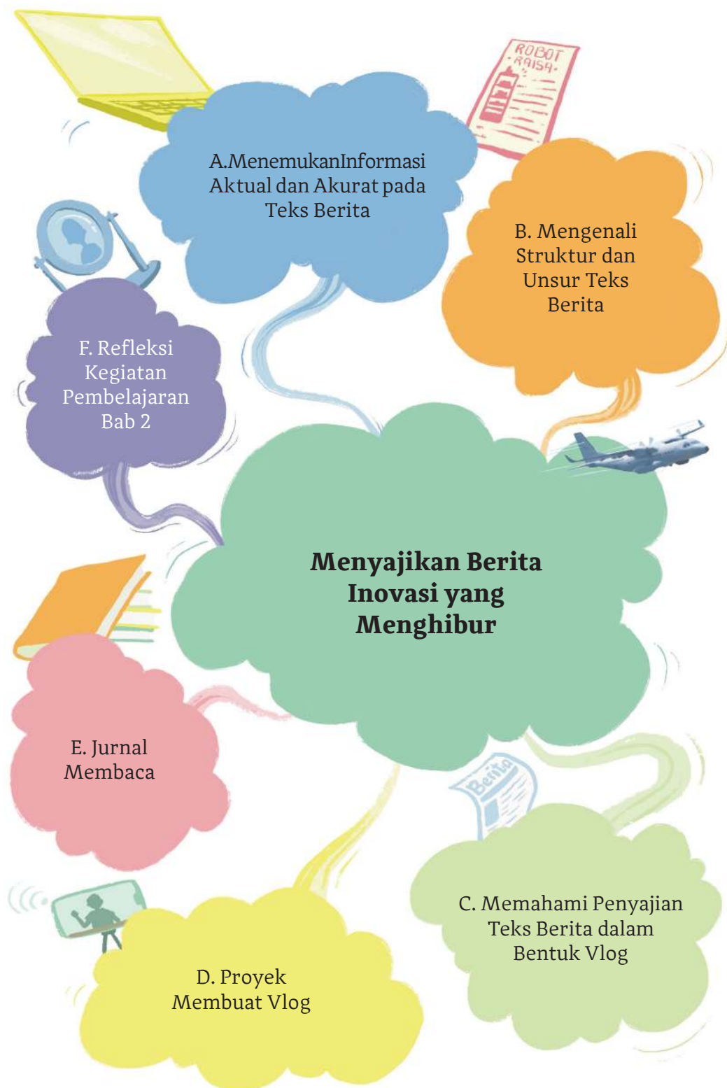
Gambar 2.1 Peta Konsep Bab 2