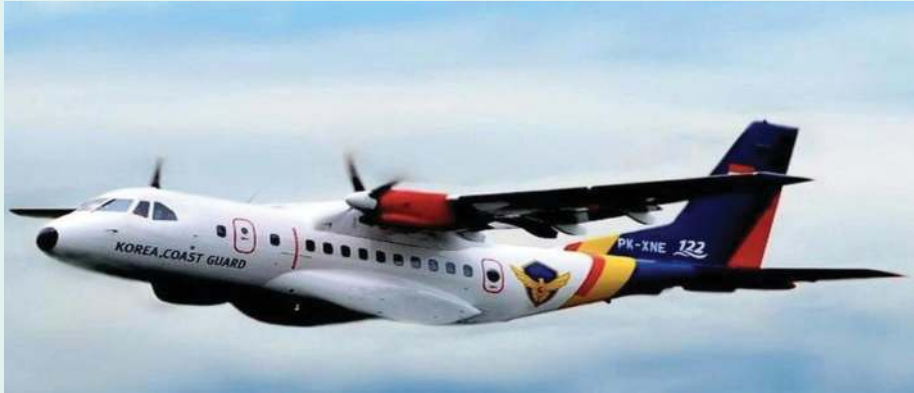
Gambar 2.3 Pesawat CN-235 Buatan PT Dirgantara Indonesia yang Dipesan oleh Korea Coast Guard

Produk pesawat terbang Indonesia makin diminati oleh banyak negara. Salah satunya adalah pesawat CN 235 yang menjadi andalan dari PT Dirgantara Indonesia (Persero) (PTDI). Ada dua tipe dari pesawat tersebut, yakni CN 235-220/MPA dan CN 235-220.