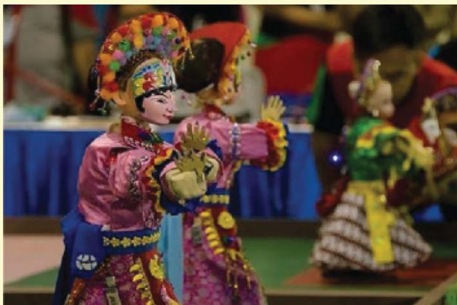
Gambar 2.2 ITS Juara Umum Kontes Robot Indonesia 2020

Dia berharap kontes ini dapat meningkatkan semangat untuk mengembangkan teknologi robot nasional. “Selamat kepada mahasiswa peserta, jangan berpuas diri dan tetap semangat berkarya.”